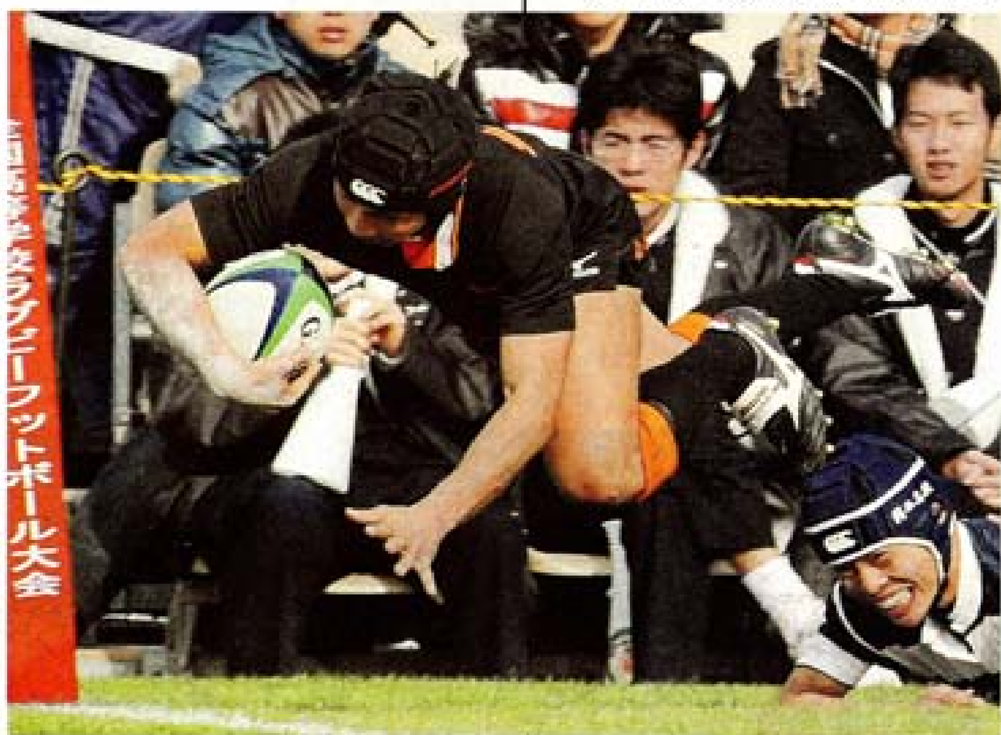
花園ラグビー大会

ること。その思いが、ない集中力を生んだ。校での練習試合と同じ相手や会場に左右され戻ってきた大舞台は母 ように、グラウンドがる。