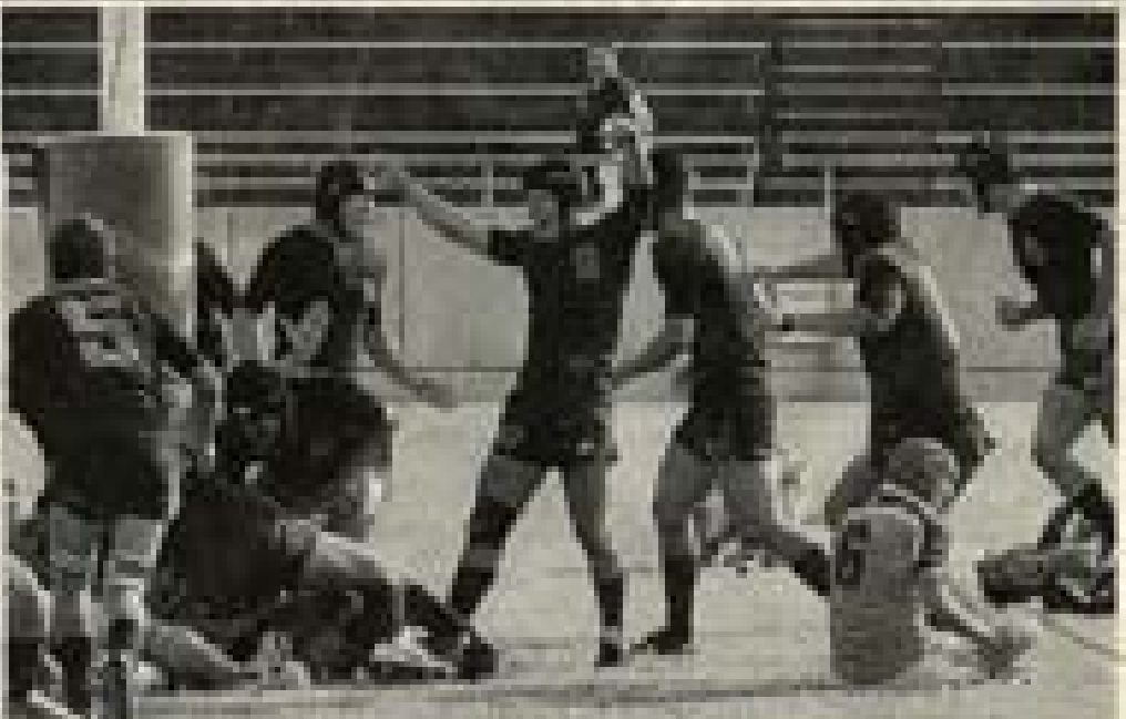
ノーサイド寸前に逆転のトライを決めて喜ぶ西陵（17日、南郷ラグビー場で）