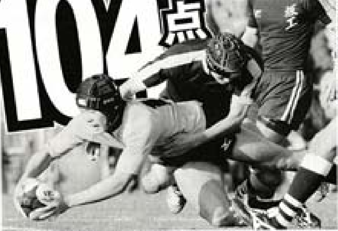
西陵は、この試合で史上9位の成績を挙げた。

【東京2020大会】西陵高校は、男子バスケットボールの予選で、12月25日、東京都立大付属高校と対戦し、104対71で爆勝した。この勝利で、西陵は史上9位の成績を挙げた。試合は前半から西陵が圧倒的な勢いでリードし、後半にはさらにペースを上げて勝利した。