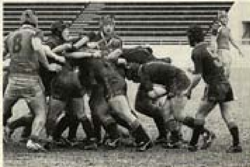
得意のモールで押しまくる西陵

ラグビーの第1回東海高校選抜大会決勝が20日、名古屋市の瑞穂ラグビー場で行われた。東海4県(愛知、岐阜、三重、静岡)の1、